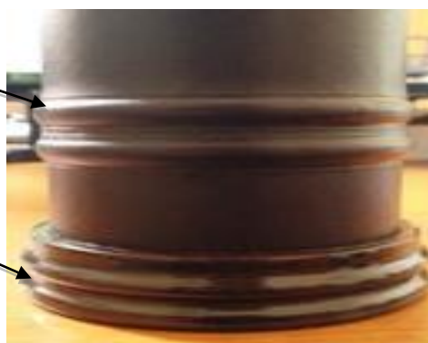
Доњи део тубе који се не отвара