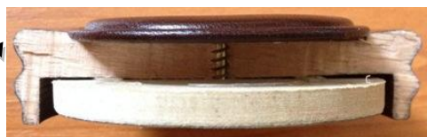
Пресек чепа тубе