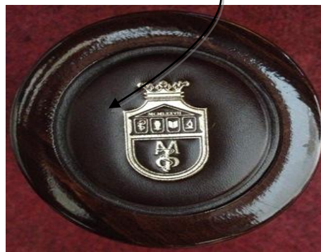
Горњи део чепа тубе